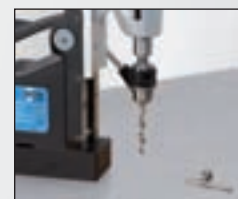
Foret hélicoïdal jusqu'à un diamètre de 18 mm