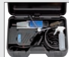
La valise de transport pratique